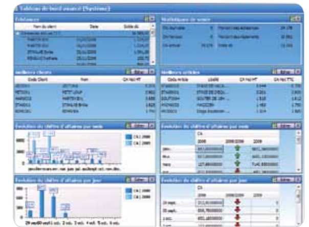
El panel de control totalmente personalizable.