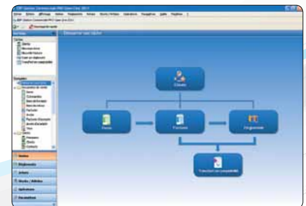
El asistente de navegación